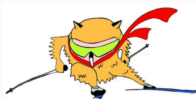
クロスカントリー スキー

キャラクター決定! ろう者の“ろう”と 幸福の“福”を 掛け合わせてふくろう 名前は“ふくちゃん”