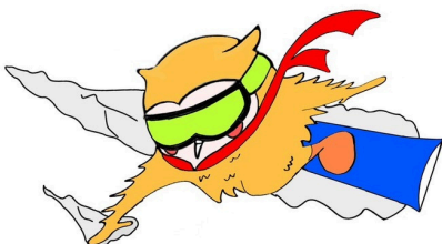
アルペン スノーボード